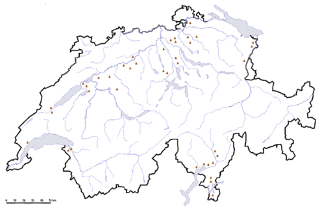
Abb. 6 | Bekannte Standorte von Erdmandelgras ( Cyperus esculentus L.) in der Schweiz, Sommer 2013.

Verschleppung: Die Verschleppung von Knöllchen muss bemerkt und verhindert werden. Einerseits gilt es, die Verschleppung innerhalb des Feldes zu unterbinden. Dies erfordert eine frühzeitige Erkennung des ersten Befalls. Andererseits muss die Verschleppung von Parzelle zu Parzelle verhindert werden. Fahrzeuge und Maschinen sollten nicht von einem verseuchten Feld zu einem sauberen wechseln dürfen, ohne vorher auf dem