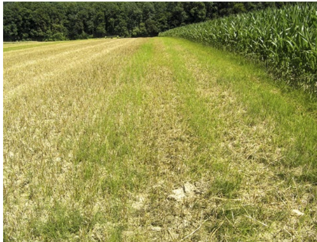
Abb. 7 | Oft breitet sich der Befall vom Feldrand aus; typisch für Erdmandelgras ist die gelbgrüne Farbe.

Bodensterilisation: Kleine verseuchte Flächen, die der Produktion von Spezialkulturen dienen, können sterilisiert werden. Es gibt Apparate zur Dampfbehandlung,