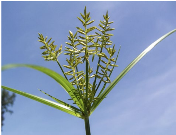
Abb. 5 | Blütenstand des Erdmandelgras. Erscheint diese Blüte auf dem Acker müssen die Alarmglocken läuten.

Die Lebensdauer der Knöllchen im Boden wird in der Literatur mit ca. fünf Jahren angegeben, wobei die Keimfähigkeit mit den Jahren abzunehmen scheint (Kassl 1992).