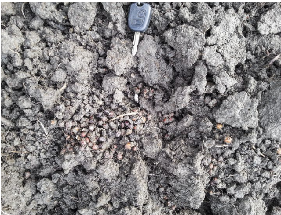
Abb. 1 | Wenn es im Winter auf dem Acker so aussieht, ist die höchste Alarmstufe erreicht.

Zusammenfassung ■ Erdmandelgras (Knöllchenzypergras) Cyperus esculentus L. gehört zu den Sauergräsern ( Cyperaceae ). Es vermehrt sich ausschliesslich über Knöllchen im Boden. In den letzten zwei Jahrzehnten hat dessen Verbreitung in der Schweiz stark zugenommen. Gründe dafür sind die veränderte Bewirtschaftung der Felder, die enorm schwierige Unkrautkontrolle und der geringe Bekanntheitsgrad dieses lästigen Unkrauts unter den Bewirtschaftern. Die Verschleppung von Knöllchen durch Arbeitsgeräte und Ernteprodukte (Wurzelfrüchte), der Mangel an parzellengenauen Daten des Vorkommens und fehlende flankierende Massnahmen fördern zur Zeit die Verbreitung von Erdmandelgras. Abhilfe würde eine Bekämpfungspflicht schaffen, die sich Bewirtschafter, Lohnunternehmer und Abnehmer von Ernteprodukten zu Nutze machen könnten. Die Sanierung von stark verseuchten Parzellen ist aufwändig und für den Bewirtschafter kostspielig.