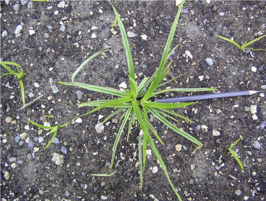
Abb. 3 | In wenigen Wochen nach der Keimung bilden sich viele Triebe um ein Mutterknöllchen.

Bodenschicht bis 20 cm zu finden; vereinzelt werden sie auch in tieferen Schichten (bis 50 cm) aufgefunden. Die Knöllchen haften an Wurzelfrüchten wie Kartoffeln, Zuckerrüben, Rando, Karotten und vielen anderen Erntegütern, sowie an Maschinenteilen und Rädern von Fahrzeugen und Schuhwerk. Dadurch werden sie auf Äckern und Gemüsefeldern mittels Maschinen und Fahrzeugen direkt oder über Ernteabfälle und Erdverschiebungen indirekt verteilt.