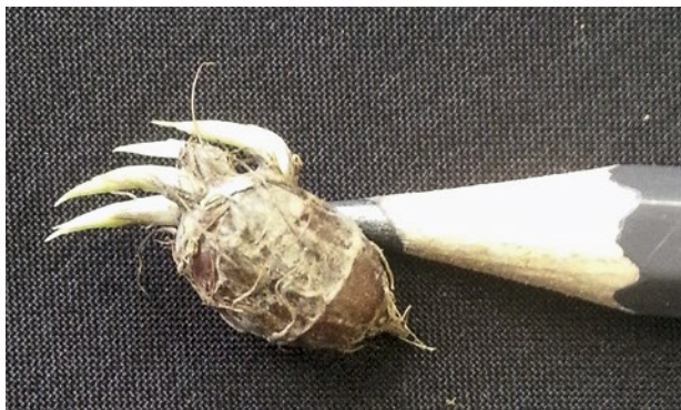
Abb. 2 | Ein Knöllchen kann mehrere Triebe bilden; Durchmesser der Knöllchen von 0.5 – 15 mm.

(Abb. 3). Aus einem Knöllchen treibt mindestens ein Rhizom in Richtung Bodenoberfläche. Knapp unter der Oberfläche entsteht eine Verdickung (Basalzwiebel) am Rhizom, aus welcher Blätter und Stängel nach oben, Wurzeln nach unten und Rhizome zur Seite hin wachsen. Entlang der Rhizome können sich weitere Basalzwiebeln bilden; am Ende der Rhizome bilden sich die Knöllchen (Abb. 4). Die neu gebildeten Knöllchen sind zunächst weiss und weich und ändern ihre Farbe im Lauf der Reifung über hell- zu dunkelbraun. Überjährige Knöllchen sind schwarz und hart. Laut Literaturangaben befinden sich mehr als 80 % der Knöllchen in den oberen 15 cm der Bodenschicht (Stoller und Sweet 1987).